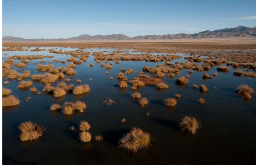
उच्च भेगका सिमसारले विभिन्न थरिका पर्यावरणीय सेवा उपलब्ध गराउँदै स्थानीय जीविकोपार्जनलाई टेवा दिन्छन्, जलप्रवाह संरचनालाई नियमन गर्छन्, कार्बन भण्डारण गर्छन् र हिमालय आरपार गर्ने पशु प्रजातीका लागि वासस्थान उपलब्ध गराउँछन् ।

हरेक वर्ष आज कै दिन मनाइने अन्तर्राष्ट्रिय पर्वत दिवस विश्वसामु यी महान, महत्त्वपूर्ण तर उपेक्षित क्षेत्रको सम्मान गर्न आह्वान पनि हो । हाम्रो साझा भविष्यलाई जगेर्ना गर्ने हो भने जलवायुमा भइरहेको तथा अन्य परिवर्तनविरुद्ध हाम्रो लडाईं तिनको प्रभाव अत्याधिक बन्ने यो उच्चतम भेग र संवेदनशील क्षेत्रका मोर्चाको रूपमा गर्नुपर्नेछ भन्ने सत्य हामीले आत्मसात गर्नु आवश्यक छ । यस वर्षको अन्तर्राष्ट्रिय पर्वत दिवसको विषय पनि सटिक छ –